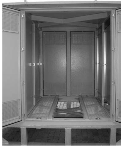
Простор за смештај трансформатора

Расклопни блок средњег напона предвиђен је за унутрашњу монтажу у виду блока који се састоји из три ћелије и то једне изводне, једне доводне и једне трафо ћелије типа DE-B+DE-I+DE-Q Ring Main Unit RM6 Schneider Electric. Расклопне апаратуре су у SF6 техници, са прикључењем каблова са предње стране.