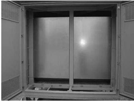
Простор за смештај НН опреме БЛОК СРЕДЊЕГ НАПОНА