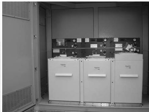
Простор за смештај СН блока