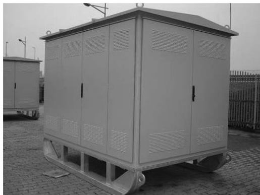
Изглед лимене ТС на санкама

Вентилациони отвори на вратима и зидовима објекта обезбеђују квалитетну природну циркулацију ваздуха за хлађење трансформатора.