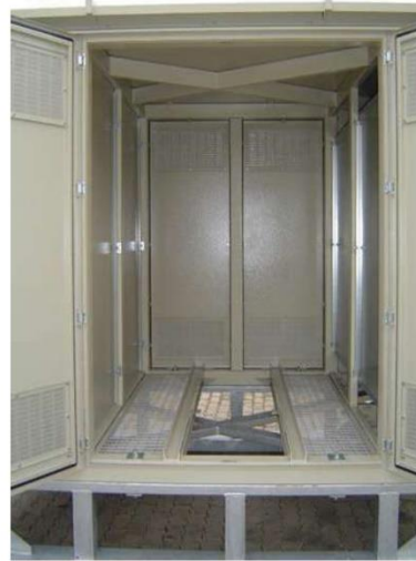
Слика 39: Простор за смештај трансформатора