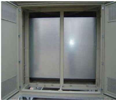
Слика 38: Простор за смештај НН опреме