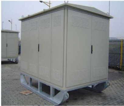
Слика 36: Изглед лимене ТС на санкама