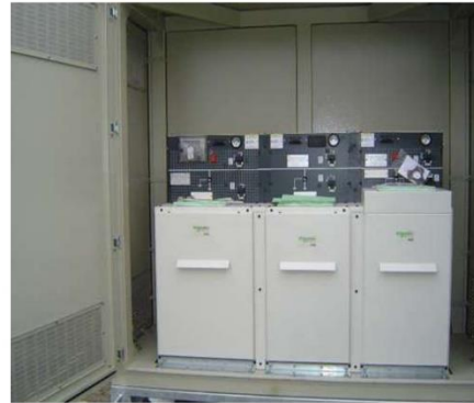
Слика 37: Простор за смештај СН блока