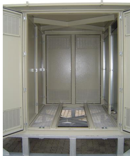
Простор за смештај НН опреме и простор за смештај трансформатора