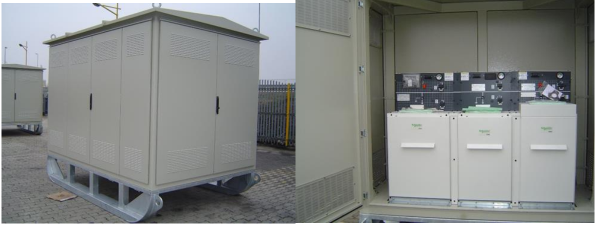
Изглед лимене ТС на санкама са простором за смештај СН блока